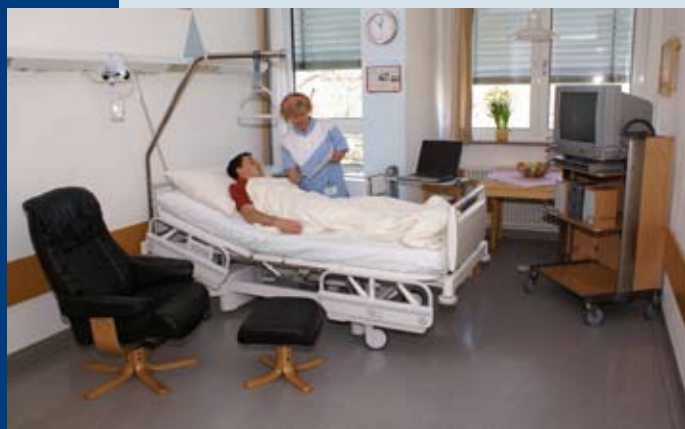
Service - Assistentinnen im Wahlleistungszimmer