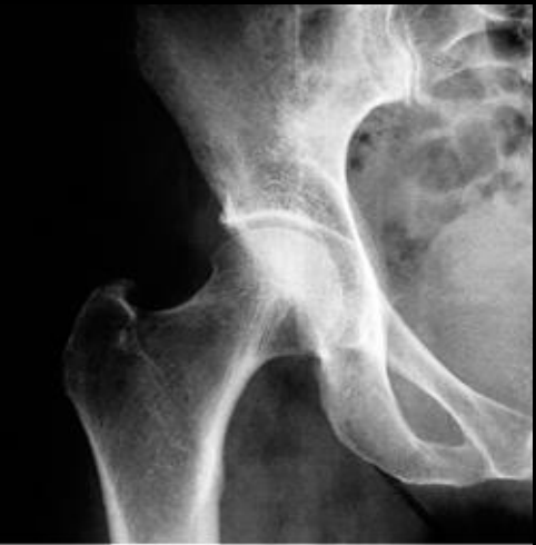
Bild: Gesunde Hüfte