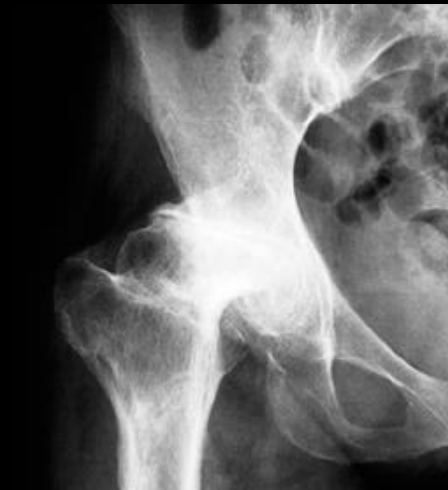
Bild: Erkrankte Hüfte