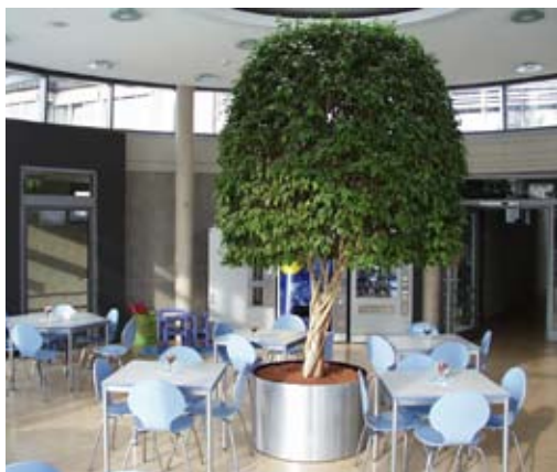
Parkcafe im Erdgeschoss