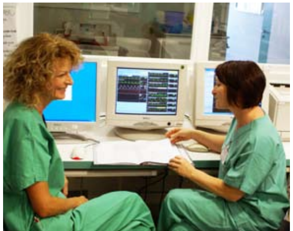
Immer im Blick: Die zentrale Überwachungseinheit

Alle Bettplätze sind mit einer zentralen Überwachungseinheit verbunden. Somit können wir – auch wenn wir nicht im Zimmer sind – sehen, was geschieht. Auch die Alarmer werden zentral übermittelt. So nehmen wir jeden Alarm wahr und reagieren nach Notwendigkeit. Nicht jeder Alarm bedeutet eine akute Bedrohung für Ihren Angehörigen.