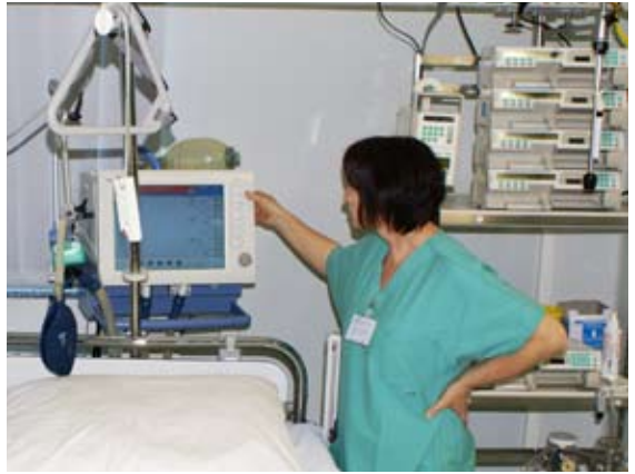
Einstellen eines Beatmungsgerätes

Die eingesetzten Beatmungsgeräte geben uns über verschiedene Alarmtöne wichtige Informationen. Dies kann auch bedeuten, dass nicht sofort jemand am Bett erscheinen muss, da unterschiedliche Alarmtöne auch auf eine unterschiedliche Wertigkeit hinweisen.